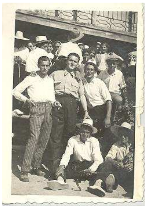
esta de 1955